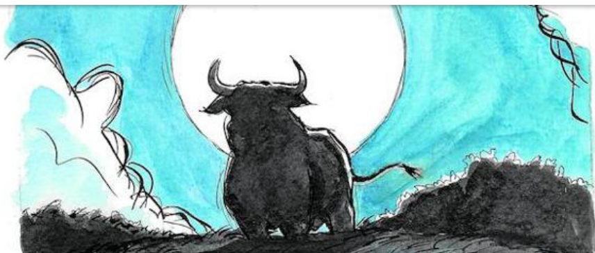
El toro frente a la nada - BARCA